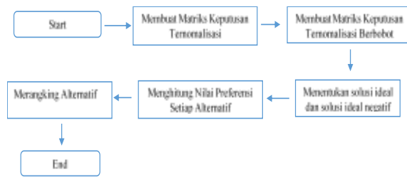
Gambar 3. Alur proses TOPSIS

Alur proses pada metode TOPSIS dapat dilihat di Gambar 3.